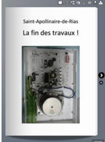
La fin des travaux