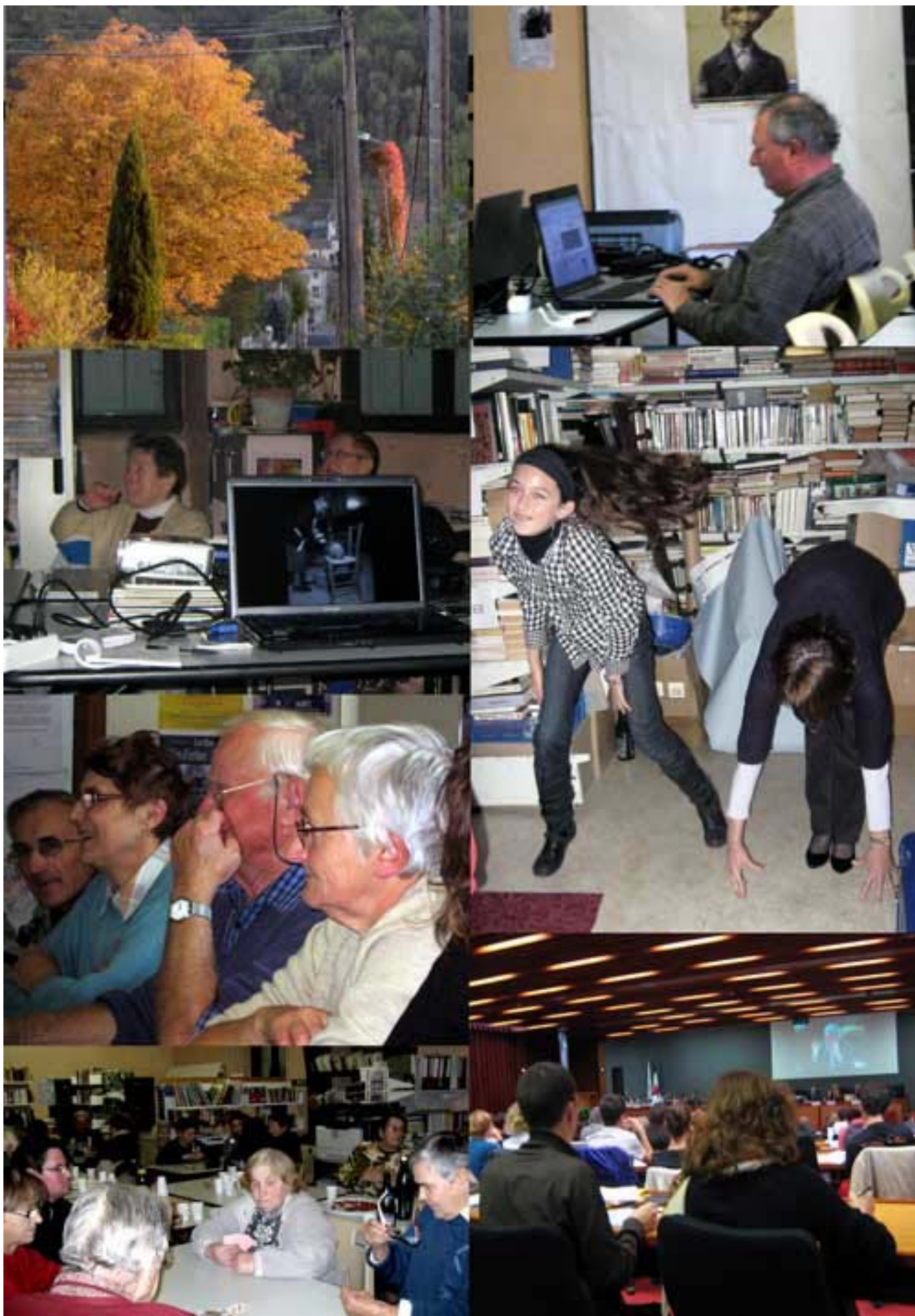
Services, communication, patrimoine, festif, participations citoyennes...