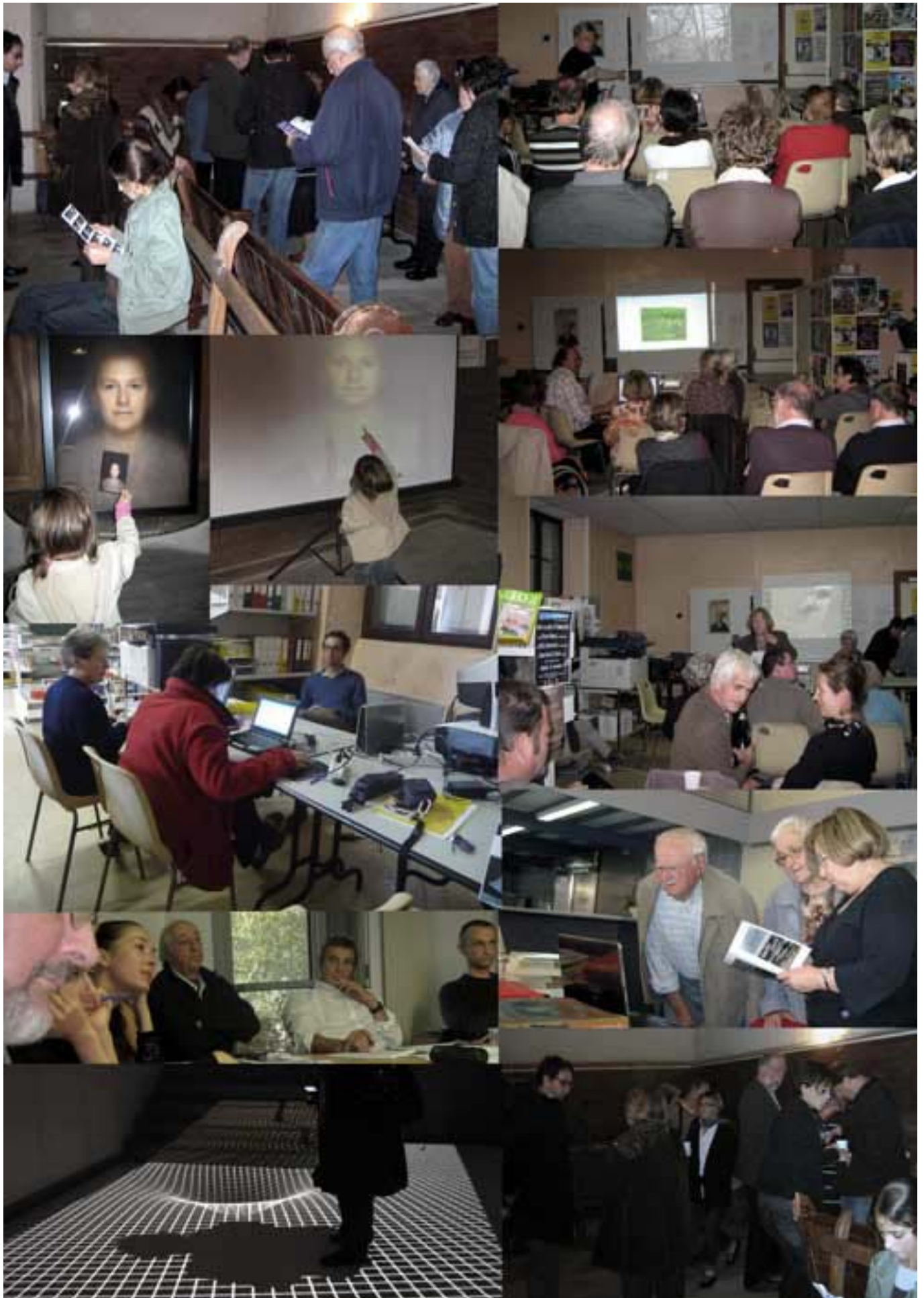
Une place importante pour les arts et les sciences : d'identité en biodiversité...