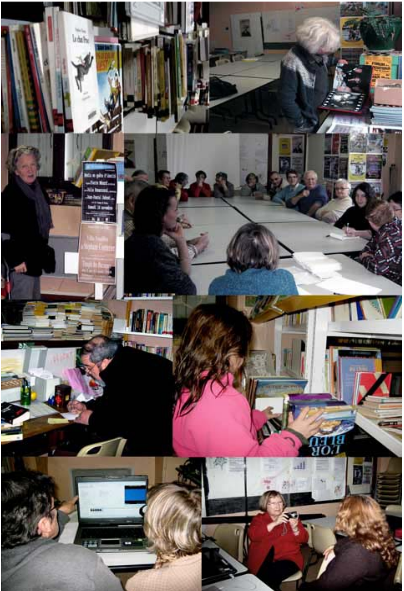
Bibliothèque, PAPI, patois, jeunes et anciens : richesse et convivialité...