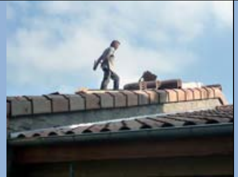
BiB/EPN de l'été.