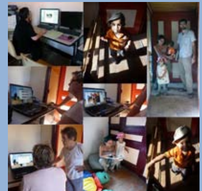
Journal Rias T2-3